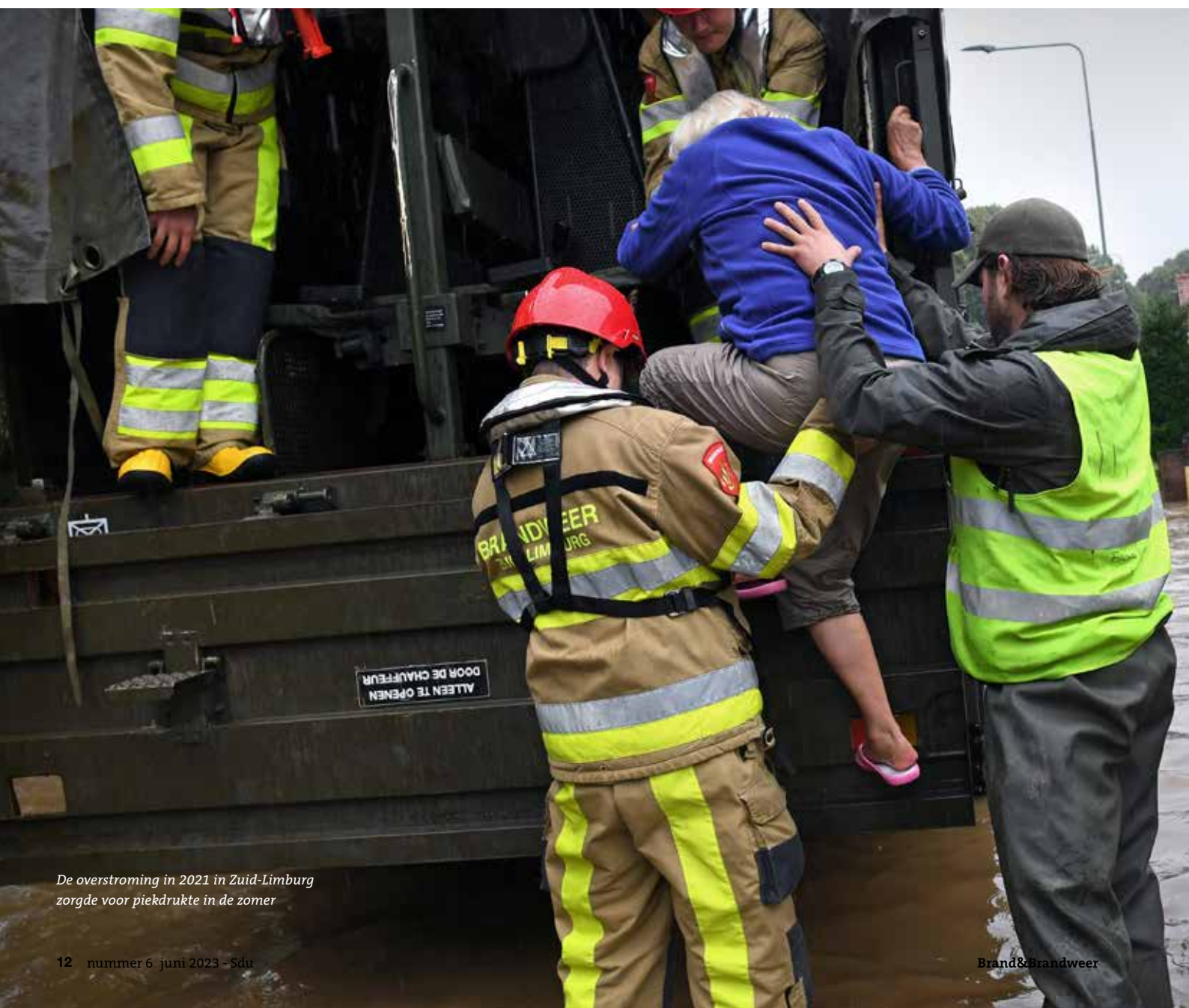
De overstroming in 2021 in Zuid-Limburg zorgde voor piekdruk in de zomer

stroomt naar beneden waardoor het hard gaat. We hadden niet voorzien dat de Geul zodanig uit de oevers zou treden dat hele dorpen overstromden.’ Het Nationaal CrisisCentrum leverde snel mankracht uit andere delen van het land. ‘Toen de Maas in 1993 en 1995 overstromde, was het moeilijk om bijstand te krijgen. Nu kregen we snel hulp van andere brandweerkorpsen. Complimenten; de crisisorganisatie is de afgelopen jaren echt verbeterd.’